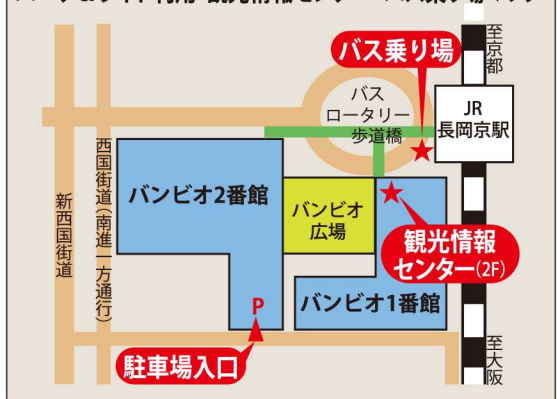
パーク&ライド利用 観光情報センター・バス乗り場マップ

■お問い合わせ先:駐車場受付 ☎075-958-6099 http://www.nud.jp/park/index.htm