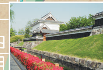
7 明智光秀「最期の城」 勝竜寺城公園