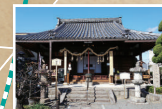
9 勝運・ぼけ封じの寺 勝龍寺