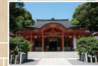
6 学問の神様 長岡天満宮