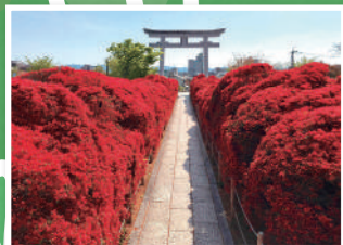
5 きりしまつじ 八条ヶ池