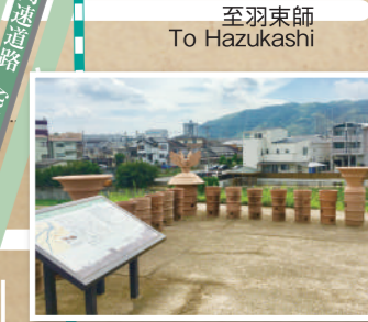
8 「山崎合戦」の光秀本陣跡 恵解山古墳