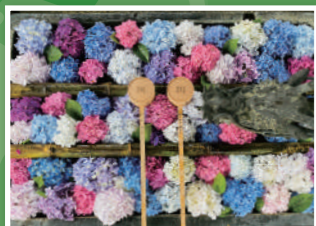
3 眼の観音様・紫陽花の寺 楊谷寺