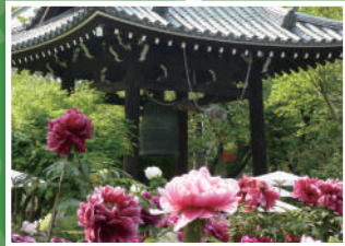
4 ボタンの寺 乙訓寺