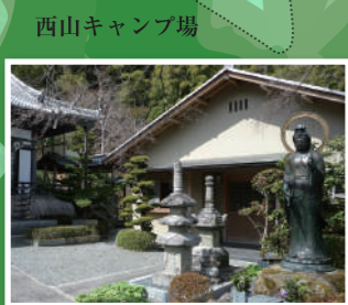
2 天合宗清瀧山 長法寺