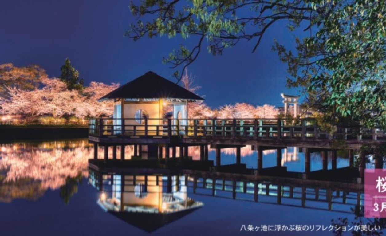
八条ヶ池に浮かぶ桜のリフレクションが美しい