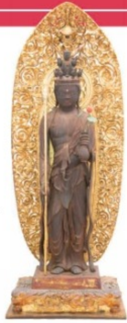
最古の一日造立仏

乙訓寺が所蔵する通常非公開の重要文化財の仏像2体を特別公開。わずか1日で造られた国内最古の“一日造立仏”「木造十一面観音立像」、「幽愁の毘沙門天」の異名を持つ平安後期の傑作「毘沙門天立像」は必見。