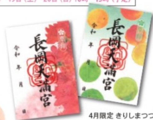
4月限定 きりしまつづじ 5・6月限定 青梅雨